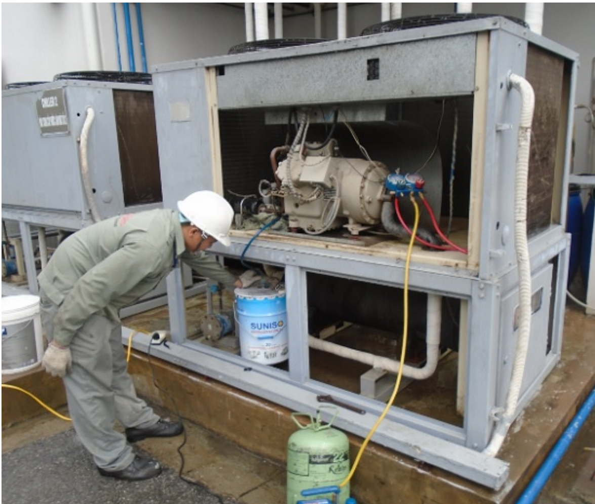
Thay dầu máy nén chiller. Ảnh minh họa

Mỗi sản phẩm máy móc thông thường khi sử dụng một thời gian chúng ta đều phải bảo trì hay bảo dưỡng sản phẩm và đặc biệt đó là hệ thống máy công nghiệp. Hệ thống máy chiller là một hệ thống bảo dưỡng hết sức quan trọng. nó nhằm tạo cho hệ thống một sự đồng bộ và cũng tránh được những hư hỏng và sự cố không cần thiết trong quá trình hoạt động của nó.